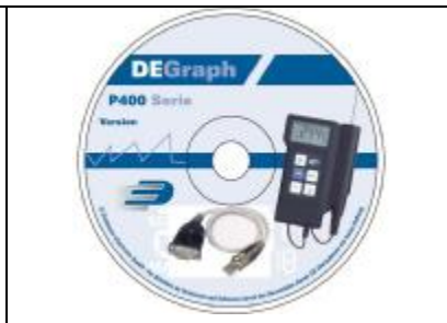
Software & USB-Kabel