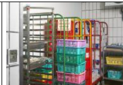
Datenaufzeichnung während der Kühlschranküberwachung Lagerung