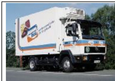
Datenaufzeichnung beim Transport