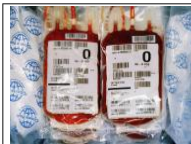
Überwachung von Blutkonserven