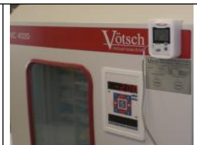
Klimaprüfung in Brutschränken